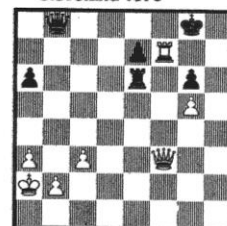
Stellung 24 R.Byrne - Tarjan Cleveland 1975