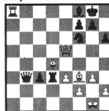
Stellung 23 Smyslow - Sosonko Interpolis-Turnier 1984