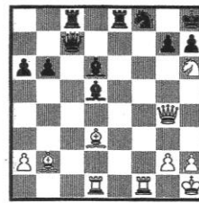
STELLUNG 63 Najdorf - Matanovic Mar del Plata 1961