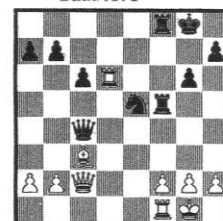
STELLUNG 64 Szabo Ivkov Bath 1973