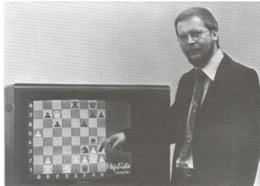
Mephisto und Fernsehen