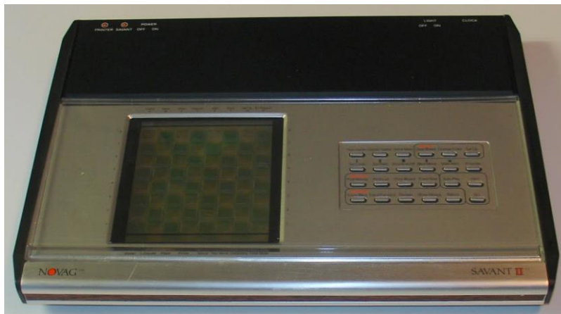
Novag Savant II

Die Fa. Novag Industries aus Hongkong war in Schachcomputer-Fachkreisen seit jeher bekannt dafür, durch besonders innovative Produkte aus dem "üblichen Rahmen" zu fallen. Man denke hierbei an den schon legendären Chess Robot Adversary oder den Super Constellation . In diesem Teil hat sich Alwin Gruber mit einem äußerst interessanten und für damalige Verhältnisse bahnbrechenden Gerätekonzept dieser Firma befaßt, welches seiner Zeit weit vorausgeeilt war: Die Savant-Reihe .