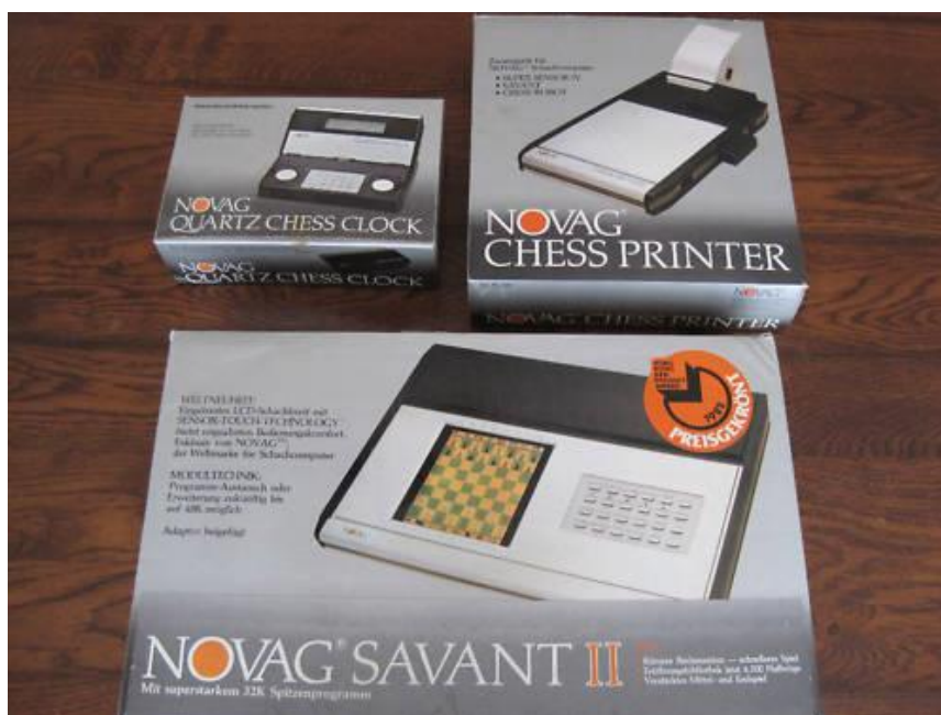
Novag Quartz Chess Clock - Novag Chess Printer - Novag Savant II