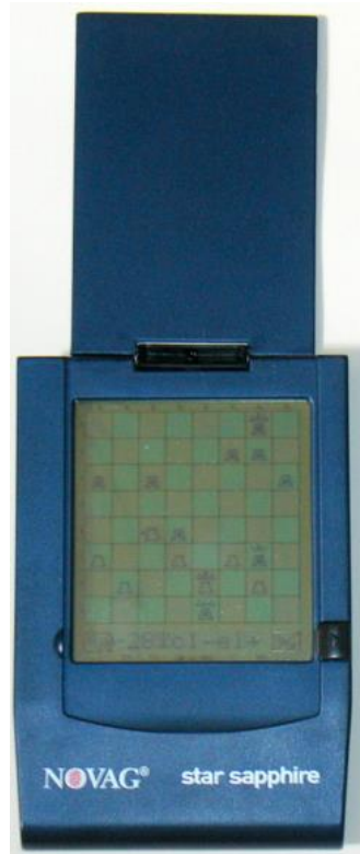
Novag Star Sapphire

Mit dem Erscheinen des Novag Star Sapphire wird voraussichtlich ab dem 1. Quartal 2001 ein äußerst spielstarker "Hand-Held"-Schachcomputer für 699,00 DM (€ 349,50) angeboten. Die Bedienung bei dem 8,8 x 11,5 x 1,3 cm messenden und nur 140 g schweren Gerät, welches sowohl mit 3 Microbatterien als auch per Netzteil betrieben werden kann, ähnelt stark dem der Savant-Reihe . Mittels eines Stiftes erfolgt auf den beleuchteten LCD-Display (200 x 240 Punkte) die Zügeingabe. Das Gehäuse besteht - ebenfalls wie beim Savant - aus blau eloxiertem Metall. Der Schachmotor stammt wieder von David Kittinger.