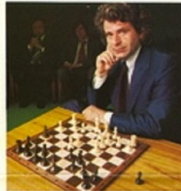
Boris Spassky, Schach-Weltmeister 1969-1972, hat den Schach-Computer Chess Champion MK I mit seiner variablen Spielstärke getestet.

Boris Spassky: „Dieser Schach-Computer ist ein neuer, interessanter Partner mit überraschenden Spiel-Varianten...“