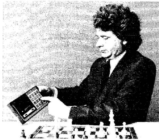
„Chess Champion MK I“, Spasski

„bis zu zwei Tagen“. Etwas versierte Spieler vermag der „Champion“ kaum ernstlich zu fordern, für einsame Anfänger dagegen ist er ein hinlänglicher Sparrings-Partner. Wenn er matt ist, zeigt er „LOSE“ (gewonnen hat er bislang noch nie).