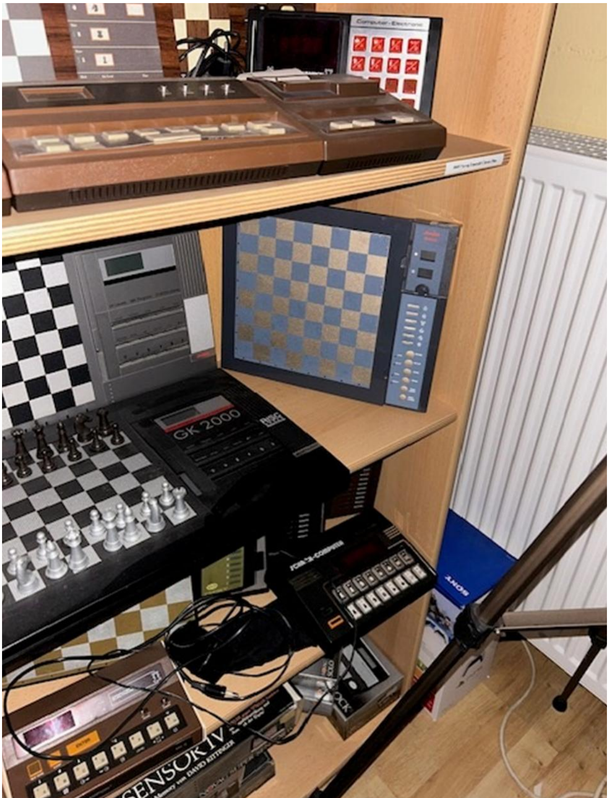
The "plastic corner"...