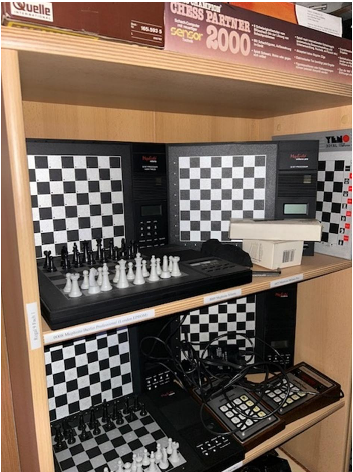
Still room for a small presentation.