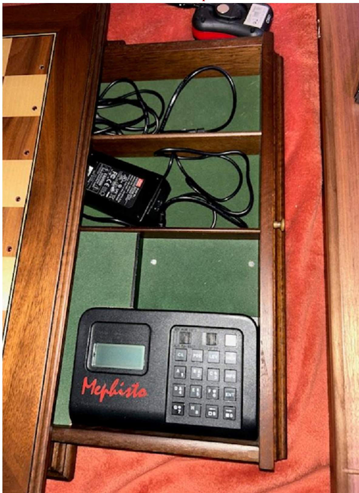
An early version of the Mephisto ESB 6000.