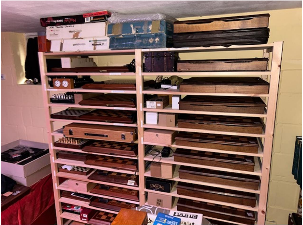
All chess computers clearly stored.