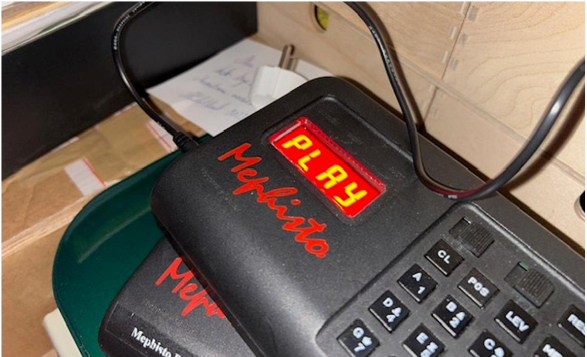
You don't see that bright red display very often.