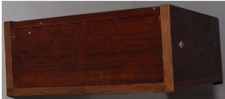
Applied Concepts Boris Master (without storage compartment)

Eine nette Idee, aber wo bewahrt man die Schachfiguren, den Adapter und ähnliches auf? Der einzige Vorteil ist, dass der Boris Master Electronic Chess Computer kompakter ist, aber ich bevorzuge das Standardmodell. Letztendlich wurde dieses Modell nicht in Serie produziert und bleibt daher ein sehr seltenes Gerät. Es könnte sich um eine Testversion oder einen Prototyp handeln, aber meiner Meinung nach ist es eine Originalausgabe. Es gibt verschiedene Hinweise darauf, dass dieser Boris Master 1979 auf den Markt kam. Unter dem goldfarbenen Schriftzug "Boris Master" steht "Applied Concepts Inc." und unter dem König-Logo (mit neuem Design) steht "Patent Pending." Anhand des Aufklebers auf der Rückseite lässt sich erkennen, dass dieses Modell vom deutschen Importeur Sandy Electronic in München verkauft wurde. Abmessungen: 18,5 x 17 x 7,3 cm.