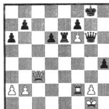
Stellung 43 Spasski - Larsen Palma de Mallorca 1969