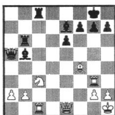
Stellung 42 Spasski - Averkin UdSSR 1973