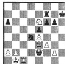
Stellung 44 Spasski - Kortschnoi Kiev 1968