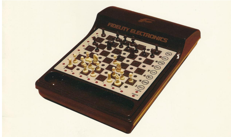
Mini Sensory Chess Challenger (Fidelity brochure 1980)

Toch is dit een zeer opmerkelijke prototype, want in de originele Fidelity brochure van september 1980 zien we helemaal achterin, en eigenlijk voor de allereerste keer (!) ook een Mini Sensory Chess Challenger staan. De afbeelding uit die brochure ziet u hieronder.