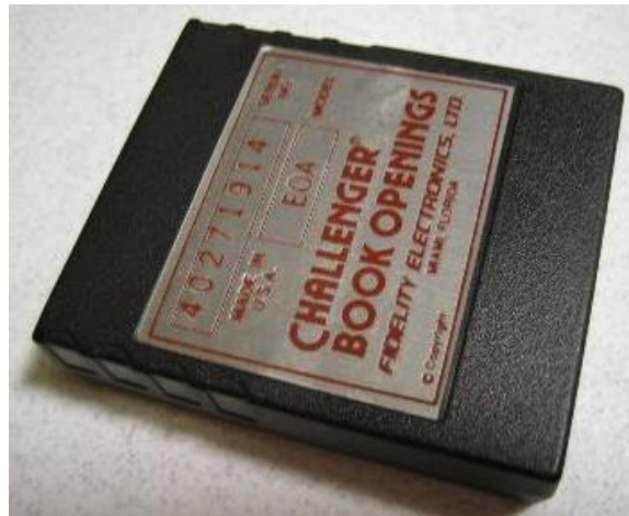
Volume A (Fidelity model EOA) Covers openings initiated by moves other than E4 or D4 ...

Deze set van vijf modules kwam in april 1984 op de markt. In Duitsland voor een prijs van DM 349,- per module. Een behoorlijk pittige prijs en nu dus uiterst zeldzaam aan te treffen!