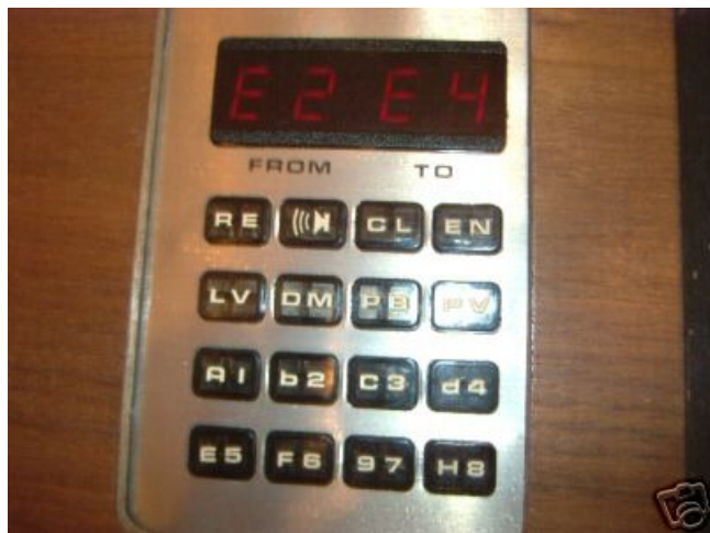
De techniek van de Chess Challenger Sensory Voice is ingebouwd ...