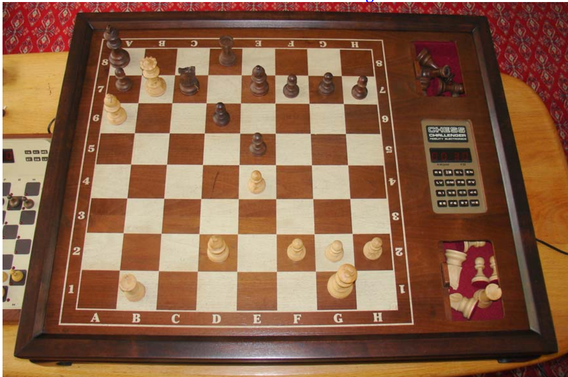
Wit: Hein Veldhuis