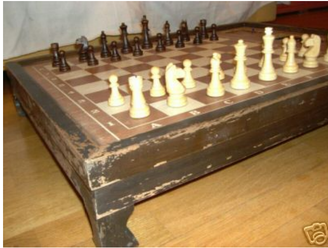
Alweer een jaar of vijf terug ging een tweedehandsje voor €1152,21 over de toonbank ...