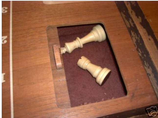
Twee opbergvakken voor de schaakstukken...