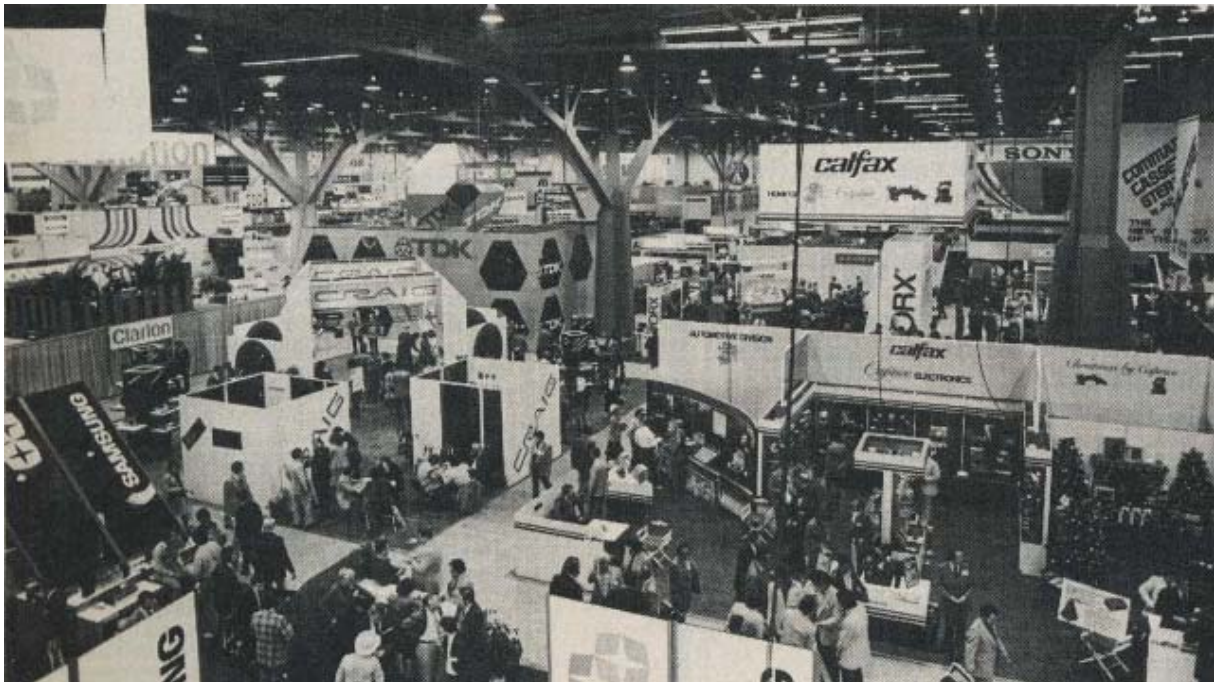
Overview of the winter Consumer Electronics Show in Las Vegas - January 8-11, 1981.

For those who want a better-looking computer, and do not need the strong program ( Champion Sensory Challenger ), there is the new Decorator , which is essentially the old Voice Chess Challenger on a stylish hardwood chess table standing on 5 inch legs.