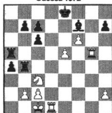
STELLUNG 110 Pressypkin - Romanischin Odessa 1972