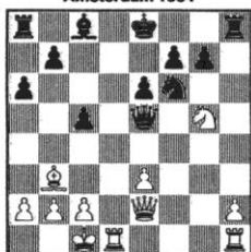
STELLUNG 112 Tal - Benkö Amsterdam 1964