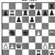
STELLUNG 111 Knaak - Pretzcher -DDR 1984