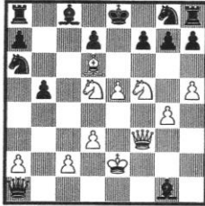
Stellung 25 Anderssen - Kieseritzky London 1851

Die Kombinationen in der „Unsterblichen“ (Stellung 25) und in der „Immergrünen“ Partie (Stellung 26) finden die Geräte ziemlich schnell; aber mit der Stellung 28 haben sie Schwierigkeiten!