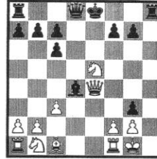
Stellung 27 Meyet - Anderssen Berlin 1859