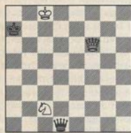
wit aan zet en wint

en elders gepubliceerd o.a. in Die Schwalbe , The Problemist en ook Schakend Nederland . De onderstaande studie was een tweede prijs in Sakkélet.