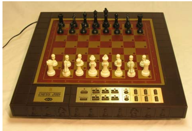
CXG Chess 2001 (with gold & brown-red board)

Model CXG-2001. Dit kunststof ARB-model is verschenen in vele andere uitvoeringen. Op de onderstaande foto heeft dit CXG model donkerrode velden, maar er zijn ook exemplaren bekend die lichtrode of groen gekleurde velden bezitten. Chess 2001 speelt alleen met een netstroomadapter.