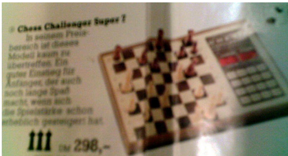
Een wazige foto, maar er staat toch écht Chess Challenger Super 7 ...

Over deze verbeteringen zijn zeer weinig of geen details bekend. De eerste berichtgeving over een verbeterde Challenger 7 verscheen in Der Spiegel van december 1979. Der Spiegel is van belang omdat deze zo vroeg verscheen, maar daarom juist ook weer voor verwarring zorgt! Want heeft Der Spiegel het hier nu over de Chess Challenger Super 7, of was er soms nog een tussenversie? Laten we hopen dat binnen enkele jaren dit mysterie definitief is opgelost!