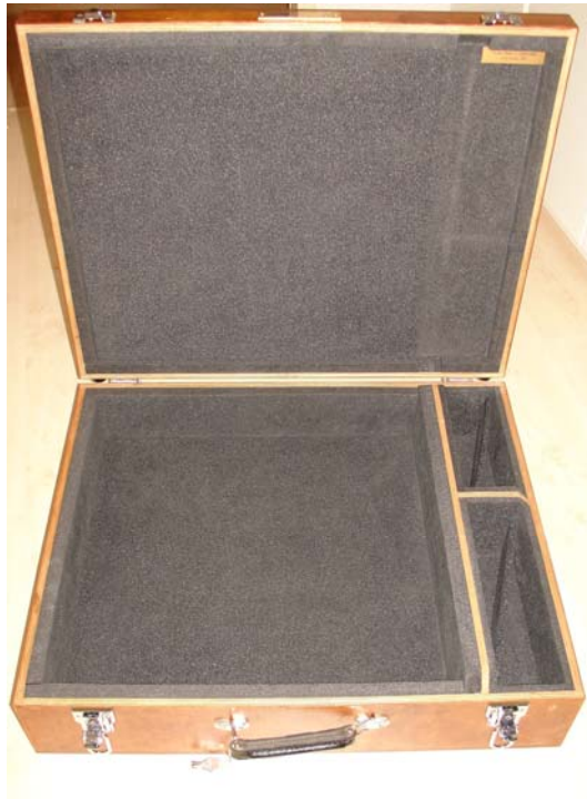
First Phoenix Cases prototype ...

Het prototype was eigenlijk overdreven degelijk. Overall 2 cm duurzaam foam wat eigenlijk voor de bescherming van een schaakcomputer niet nodig is. Als je de deksel dichtgooide hoorde je een soort dof geluid zoals dat van een dure auto waarvan je het portier sluit.