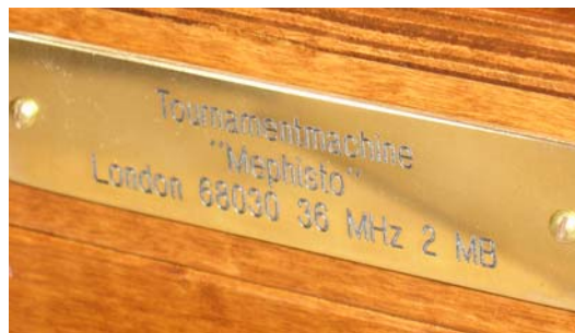
Brass sheet: Tournamentmachine Mephisto London 68030 36 MHz 2 MB

Zie: http://www.schachcomputer.at/phoenix.htm . En niet zonder gevolgen. Wil men een koffer bestellen dan zal men soms 2 tot 3 maanden moeten wachten vooraleer men zich eigenaar kan noemen!