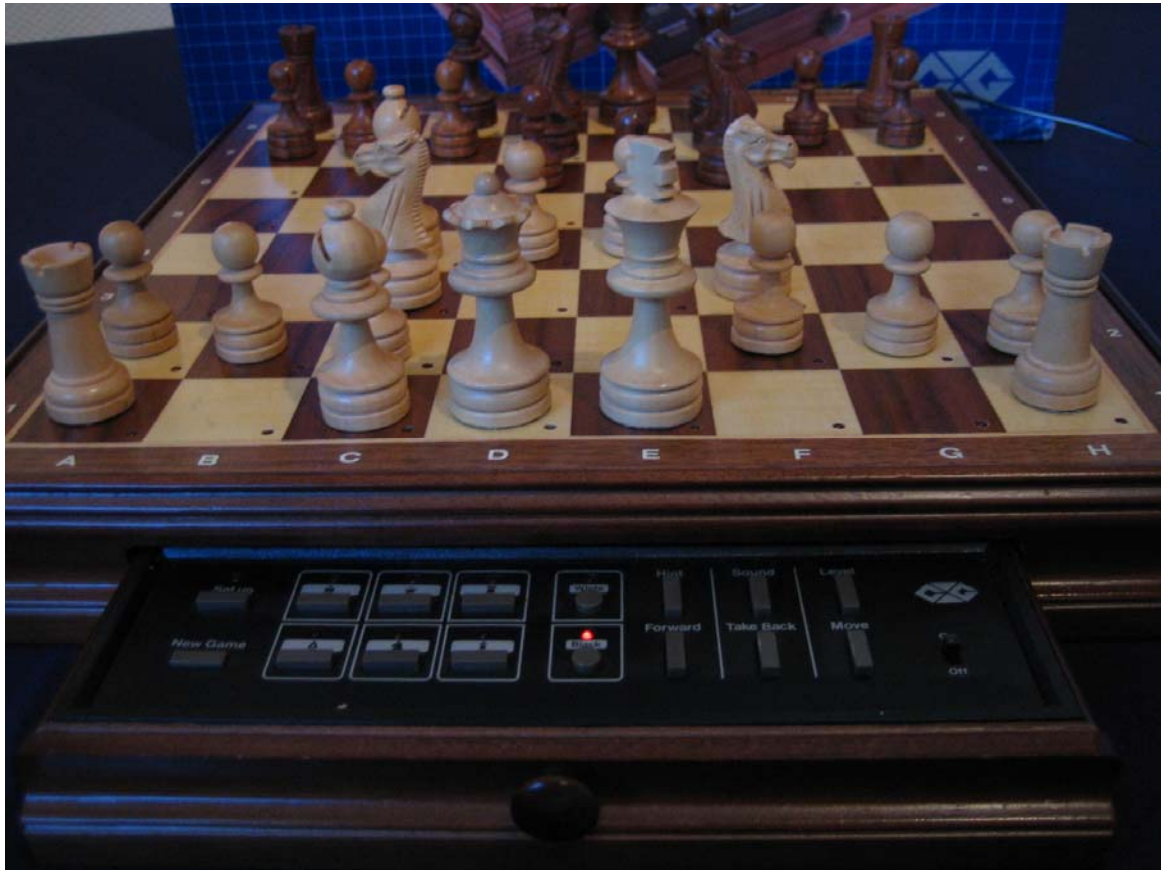
Magnetsensor-Holzbrett mit einer Spielfläche von 29 x 29 cm. für Netzbetrieb Bedienelemente in einer Schublade und Programm wie CXG Chess 2001

Model Chess 3000 zou in eerste instantie verschijnen met een Kaare Danielsen programma. Uiteindelijk koos men bij CXG toch voor een schaakprogramma van Richard Lang welke al bijna 3 jaar als Chess 2001 op de markt was verschenen.