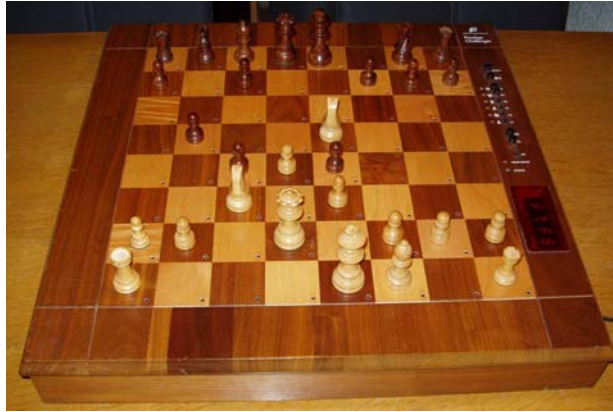
The very first Prestige Challenger with flat display!

Fidelity nam het design van de tafel én schaakcomputerbehuizing over van Chafitz / Applied Concepts, en bouwde er onder andere een platte info-display in en noemde dit model Prestige auto sensory Challenger. Uit mijn blote hoofd heeft onderstaand model: serienummer 192.