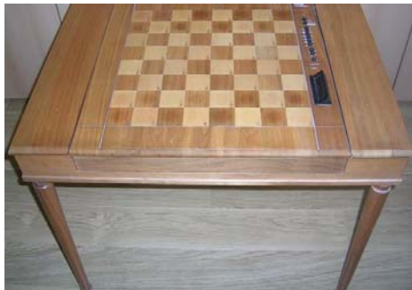
Karpov played many games on this computer chess table!