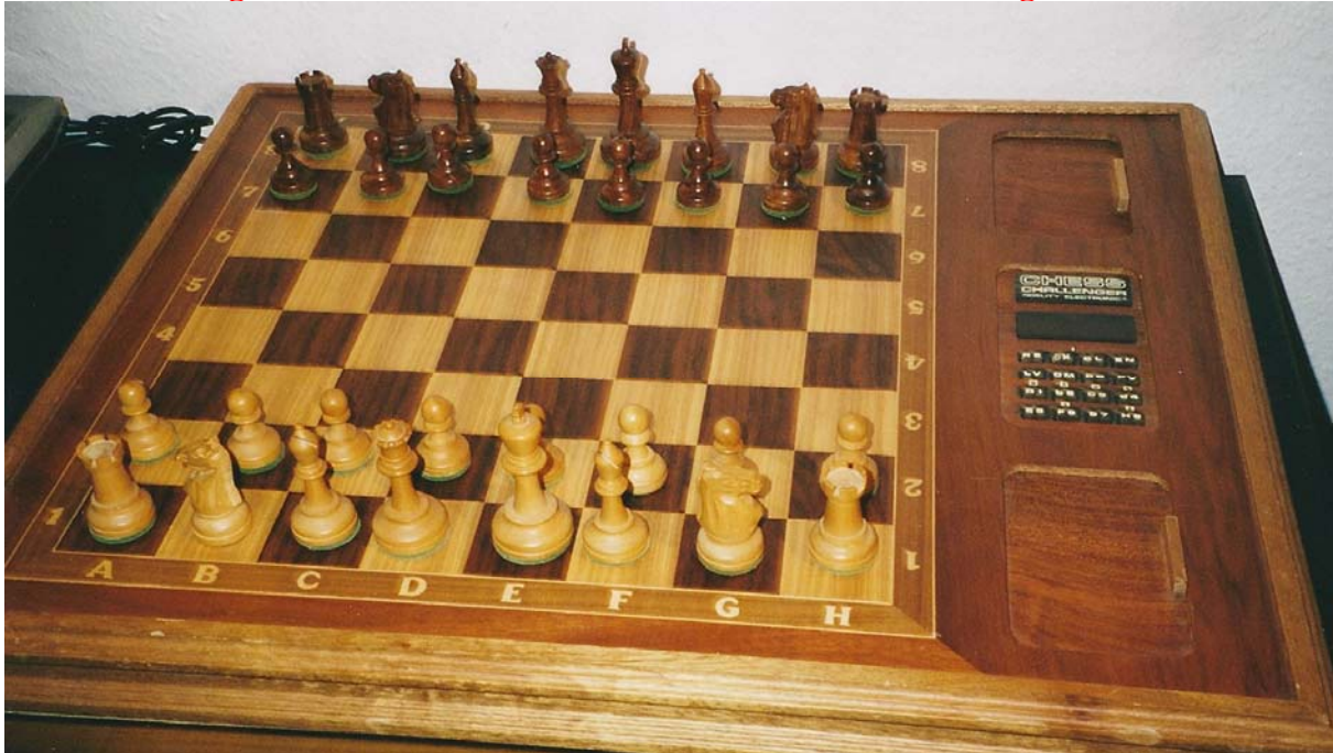
Der Chess Challenger Grandmaster Voice hat zwar keine Sensoren aber Turniergröße!

Elektrische Sicherheit des Netzteils bei Verwendung mit Schachcomputer: Trafo ist nicht kurzschlußfest. Zulässige Temperaturen beim Kurzschluß nicht eingehalten. Kriech- und Luftstrecken werden nicht eingehalten.