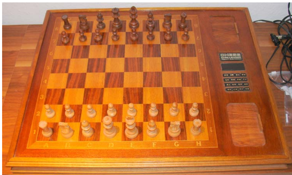
Fidelity Chess Challenger Grandmaster Voice

Ook bij de Chess Challenger Sensory Voice , een direkte voorloper van de Chess Challenger Grandmaster Voice , ging er ook al 'iets fout' om het schaakprogramma te verbeteren. De eerste versies die op de markt verschenen konden 'opeens' een kale koning, met één toren niet matzetten! Fidelity gaf daar (zoals gewoonlijk) geen richtbaarheid aan, en nog tijdens het productieproces werd dit 'weeffoutje' stiekem hersteld. Zodoende beschikken de huidige verzamelaars over een Chess Challenger Sensory Voice (A) of een Chess Challenger Sensory Voice (B) , zonder vaak te weten dat er verschillende versies zijn! Om de complete familie rondom de Chess Challenger (Sensory) Voice op te noemen, komt als laatste telg, de Decorator Challenger in beeld. Laten we hopen, dat deze laatste versie geen 'verborgen gebreken' in zijn schaakprogramma heeft, en gewoon mat kan zetten met één toren tegen een kale koning, of mat kan zetten met twee lopers tegen een kale koning. De ultieme test voor de Chess Challenger Grandmaster Voice of de Decorator Challenger is matzetten met loper en paard tegen een kale koning. (Zie weer het bovengenoemde item op pagina 14, waarbij óók dit eindspel getest werd.) Luuk, dit is echt iets voor jou om te testen!!