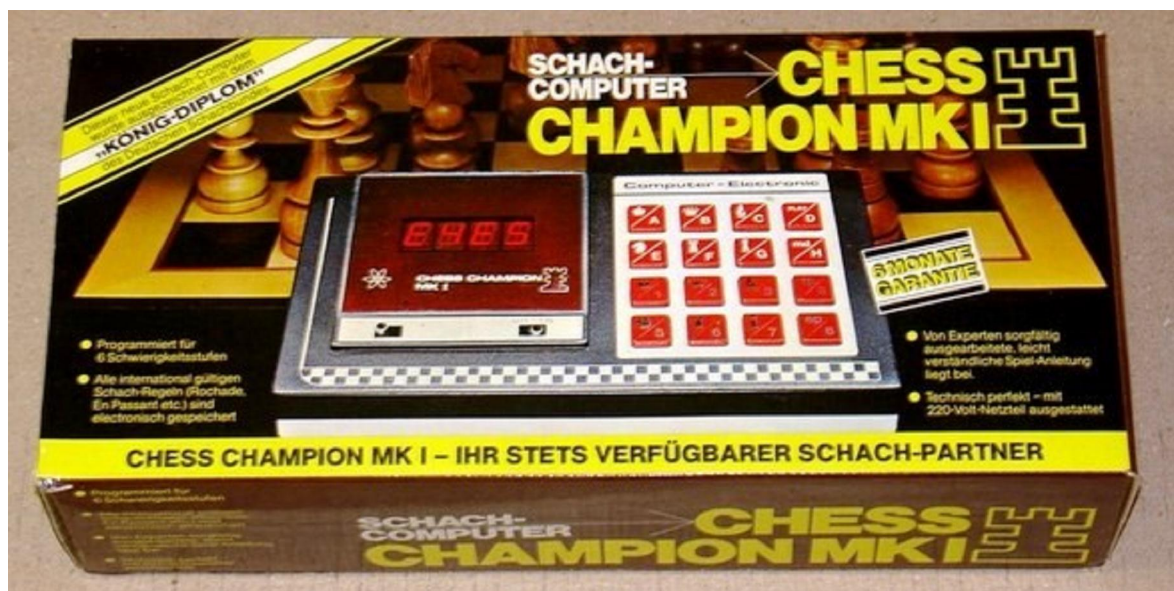
Chess Champion MK I (A) with Karpov packaging