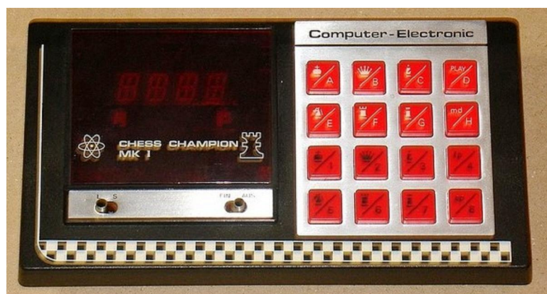
Chess Champion MK I (A) (Bild: Luuk Hofman)