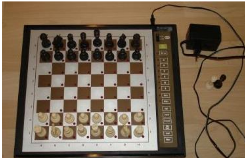
CXG Galaxy Mark VII

Dat is dan jammer, want hij is altijd even vriendelijk en correct. Hij vroeg zich af, of het afgebeelde Tedelex model een kloon is van de CXG Galaxy Mark VII.