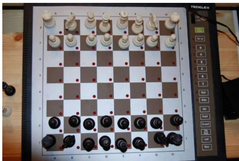
Tedelex Galaxy Mark VII