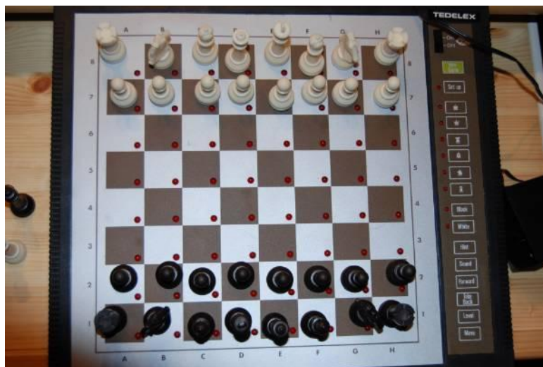
Tedelex - Galaxy Mark VII