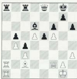
Deep Blue - Kasparov 2e matchpartij

Deze stelling vormt de inleiding tot het vreemdste moment van de match.