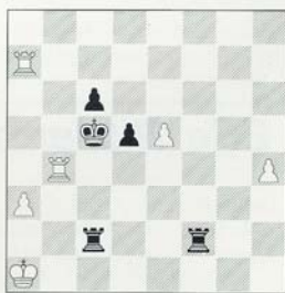
Deep Blue - Kasparov Vierde matchpartij

De zet van de computer laat wel eeuwig schaak toe, maar dat bleek onbeduidend. Zwart gaf namelijk op. Direct na de partij werd ontdekt dat zwart op 45. ... De3 46. Dxd6 rustig 46. ... Te8 kan doen, waarna wit de looper moet geven om eeuwig schaak te vermijden: 47. Lf3 Dc1+ 48. Kf2 Dd2+ 49. Le2 Df4+ 50. Ke1 Dc1+ 51. Ld1 Dxc3+ . De laatste poging van de via het Internet communicerende analytici was 47. h4 . Dit wint na 47. ... Dxe4 48. Ta7+ Kg8 49. Dd7 Df4+ 50. Kg1 De3+ 51. Kh2 Df4+ 52. Kh3 De3+ 53. g3 , maar 47. ... h5! wat schaakjes op g4 mogelijk maakt, garandeert remise. Tenslotte leidt 46. Dd7+ Kg8 47. Dxd6 Tf8 tot soortgelijke varianten als hierboven. (1-0)