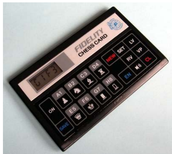
Fidelity Chess Card - model 6115