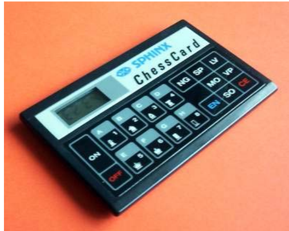
CXG Sphinx Chess Card - CXG-241

Van het origineel - CXG Sphinx Chess Card - zijn er nog twee versies verschenen: Schneider Chess Card en Fidelity Chess Card