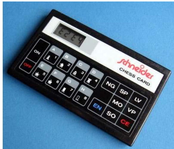
Schneider Chess Card - CXG-241