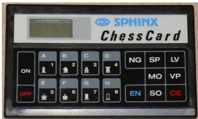
CXG Sphinx Chess Card - CXG-241