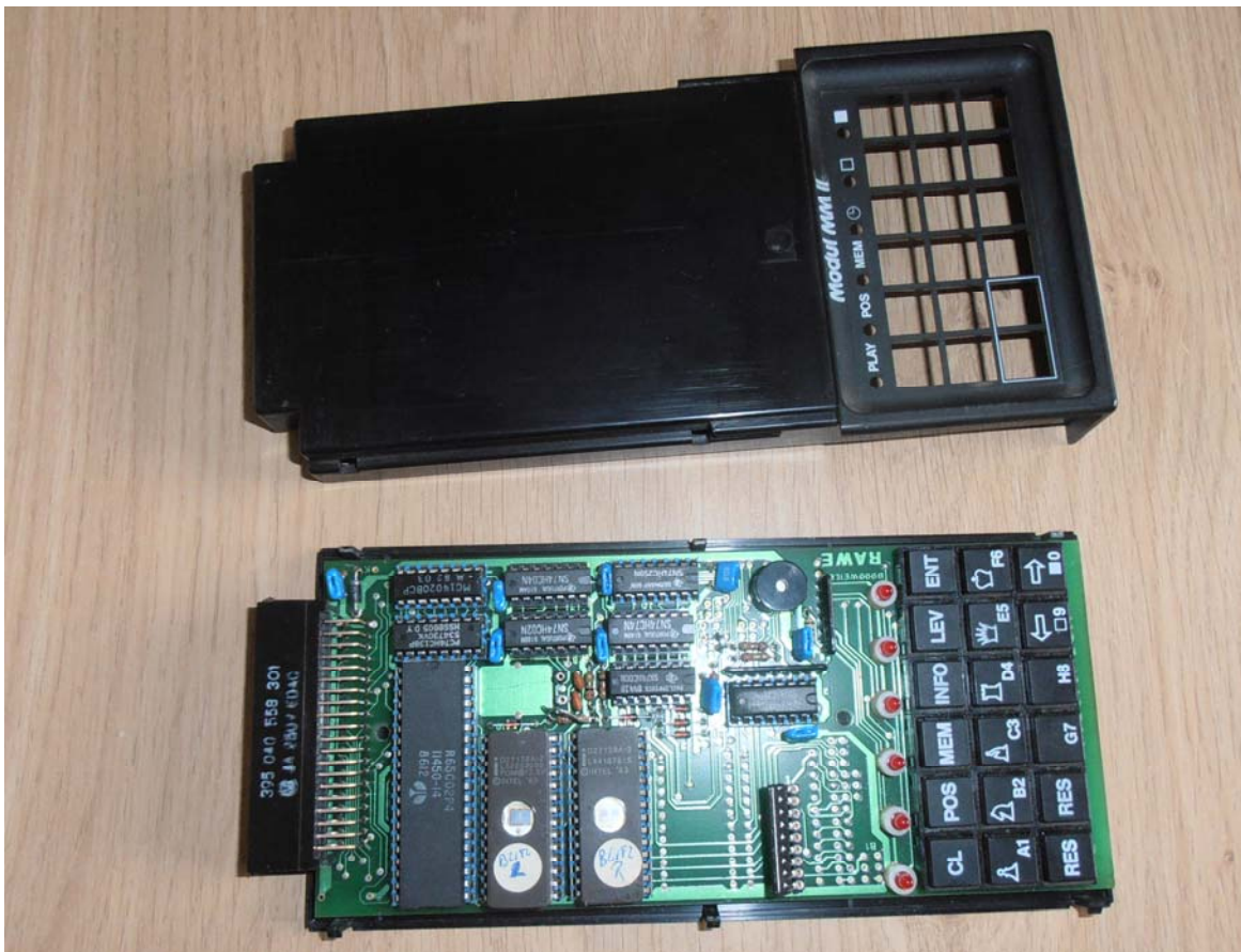
Op de EPROMs staat duidelijk 'Blitz2'